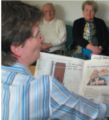
Wissen was los ist: die Zeitungsrunde.

Jeder hat seinen festen Platz, der Tagesablauf ist sinnvoll gestaltet. Das regelmäßige Zusammensein vermittelt Schutz und Sicherheit und motiviert zum Aktivsein. Jeder ist gefordert, sich seinen Möglichkeiten entsprechend am Gruppenleben zu beteiligen und mit all seinen Stärken einzubringen.