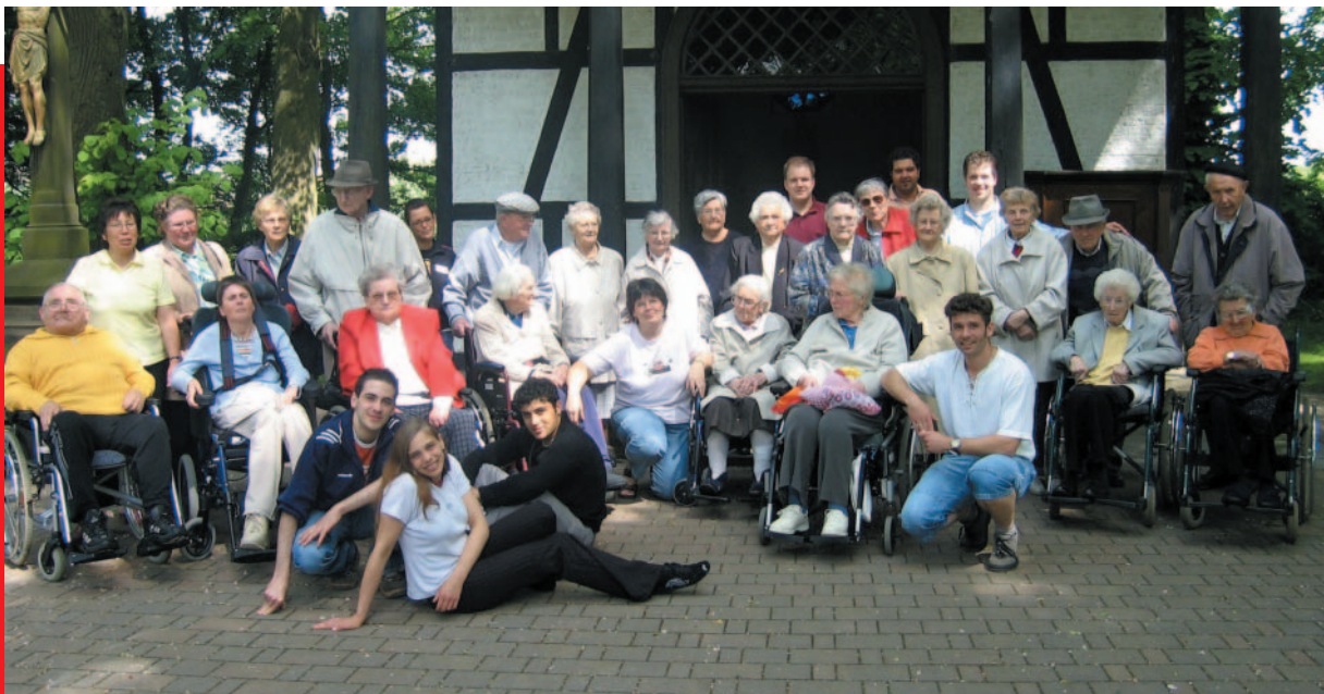
Wallfahrt nach Verne - die Tagespflege ist dabei.