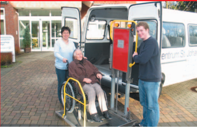
Das Tagespflegehaus hat einen eigenen Fahrdienst für die Gäste.