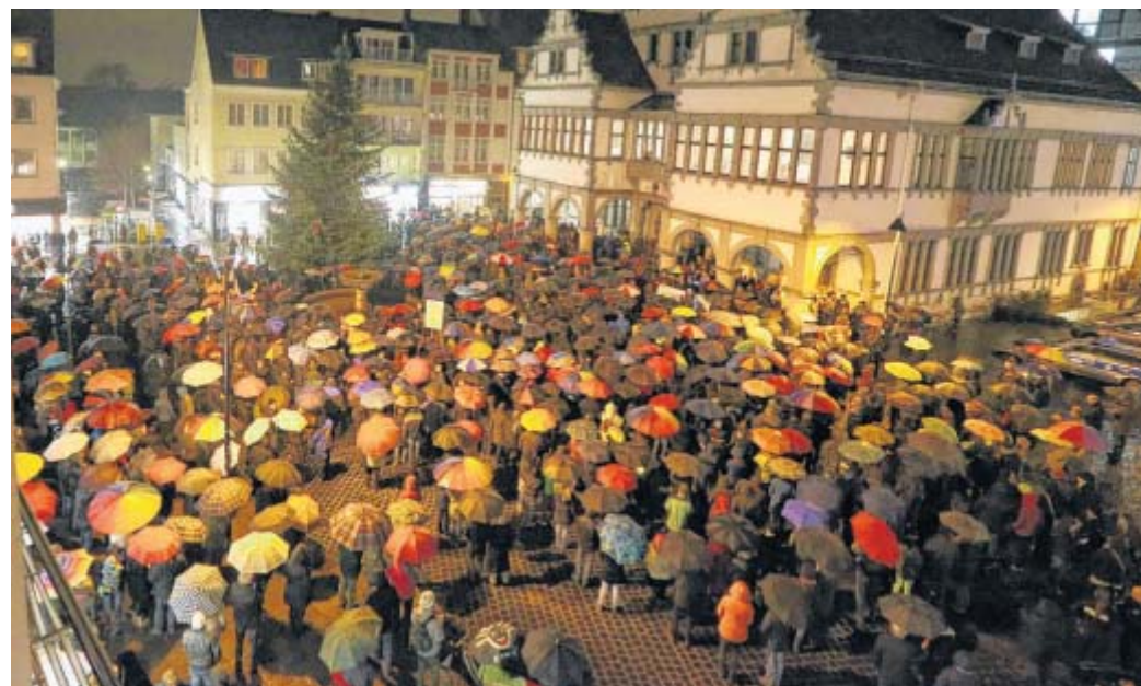
Buntes Paderborn: Mit farbenfrohen Regenschirmen schützten sich die Teilnehmer der Kundgebung auf dem Rathausplatz vor dem miesen Wetter. Die Menschenkette schlingelte sich bis zum Königsplatz.