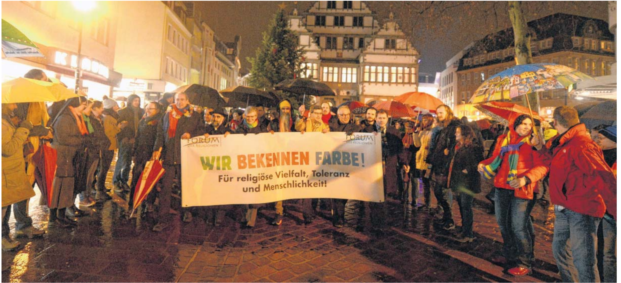
Teilnehmer stehen Spalier: Nach der Kundgebung auf dem Rathausplatz machten die Veranstalter mit dem Transparent auf das Motto der Menschenkette aufmerksam. Immer wieder gab's Applaus und Bravorufe.