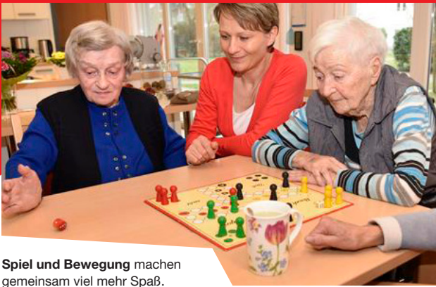
Spiel und Bewegung machen gemeinsam viel mehr Spaß.