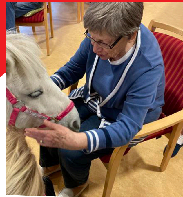
Ponybesuch | Sie sagen uns was Sie möchten: Wir sorgen dafür, dass Sie sich wohlfühlen!

Wichtig ist uns auch der Kontakt nach außen.